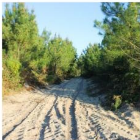
LE CIRCUIT ROSE DES PLAGES