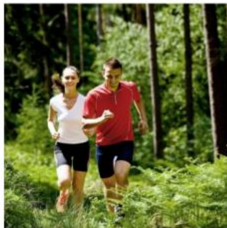
IDÉE FOOTING 5 KM

En conclusion, je pense que la proposition détaillée, pratique, généreuse de balades et de randonnées est encore un vrai élément de différenciation pour l'office de tourisme. Tant que cette fonction n'a pas encore été totalement ubérisée, profitons-en!